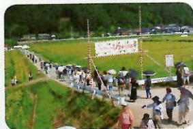
②ひまわり畑の中には日 よけ場所がないので日傘 や帽子、ドリンクの持参 が必須