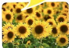
①広大な敷地で1ヵ 月間にわたりひまわり が咲き続ける。珍し い品種にも注目!