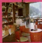
①安全性の高いひま わり油を使用したドレ ッシングやカレーはお みやげにおすすめ

③兵庫県佐用町船越232-1 ④電車: JR姫新線播磨徳 久駅からタクシーで20分 ⑤車: 中国自動車道佐用ICか ら県道72号経由、約30km ⑥8時30分〜17時15分 ⑦月曜 ⑧20台