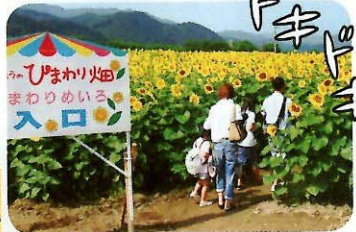
①ひまわり祭りの目玉であるひまわり迷路。 意外と複雑なので心して挑もう