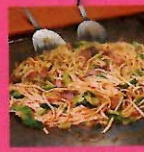
①ホルモンと野菜 のうま味が染み込 んだうどんはマイル ドな味わい